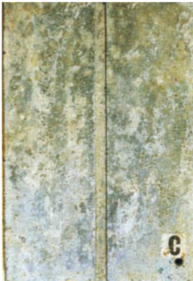
Et 6 mm bredt fræset spor gennem en 60 µm tyk zinkbelægning på stål og eksponeret i 5 år i svært industrimiljø i Holland. Bemærk belægningen af zinksalte i sporet der er uden rustangreb.

Yderligere information ved henvendelse til: